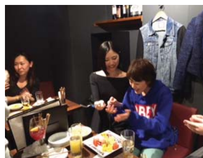
▲毎日のように一緒に働くスタッフとの関係作りは非常に大切。こういった場を設けることも働きやすい職場環境作りの一環です。