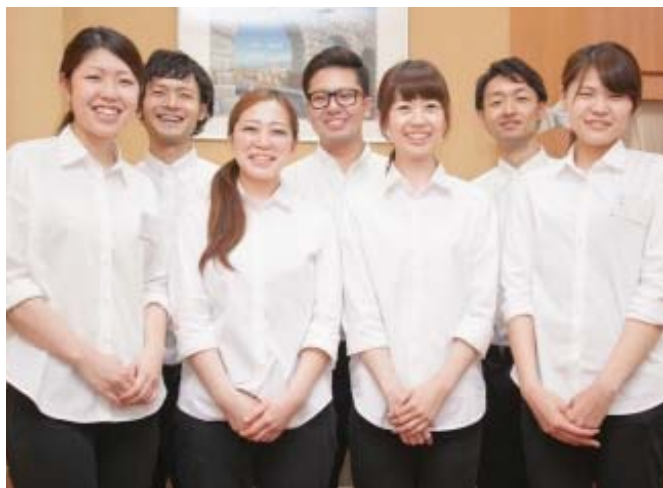
▲良きライバル・良き仲間と一緒に、充実した日々を送りましょう!

一流の立地・一流のコラボが実現する吉澤流！ 一流の収入！一流の待遇！一流の理容師！ 私たちは理容業の新しい形であり続けます！